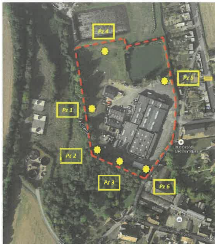
Plan 1 : Emplacement des piézomètres